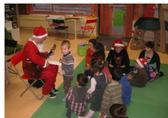
LE TEMPS DE CONVIVIALITE

(Ce temps a lieu dès 14h30 lors des mercredis hors vacances scolaires)