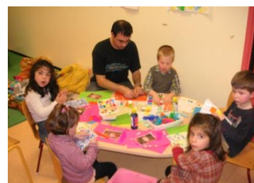
LA SALLE DES PETITS BOUTS

Enfin, nous avons à notre disposition la cour de l'école , munie de deux structures de jeux, d'un préau, un bac à sable et un tableau de craies.